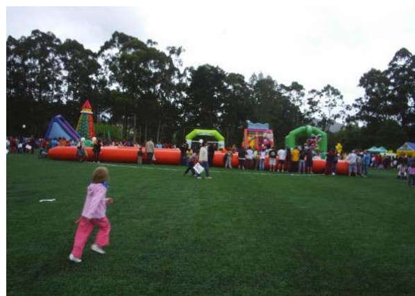
Pista de hinchables