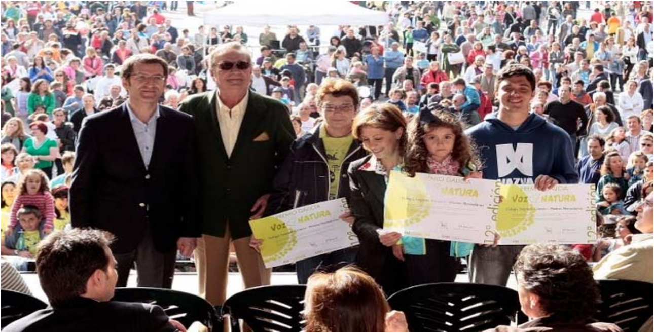
El Presidente de la Xunta, el Presidente de La Voz de Galicia y la Ministra de Medio Ambiente durante el acto de entrega de los galardones.

El pasado día 6 de junio se celebró la jornada "Voz Natura" organizada por La Voz de la Galicia, con la colaboración de destacadas instituciones y la asistencia del Presidente de la Xunta, la Ministra de Medio Ambiente y el Presidente de La Voz de Galicia, entre otras autoridades. Por primera vez, Coeticor, participó con la instalación de un stand informativo donde se distribuyó diversa documentación en materia de sostenibilidad, asesoramiento a los Consumidores y Usuarios en sus compras responsables, y reclamaciones de productos y servicios, así como los lugares dónde deben acudir en tales circunstancias.