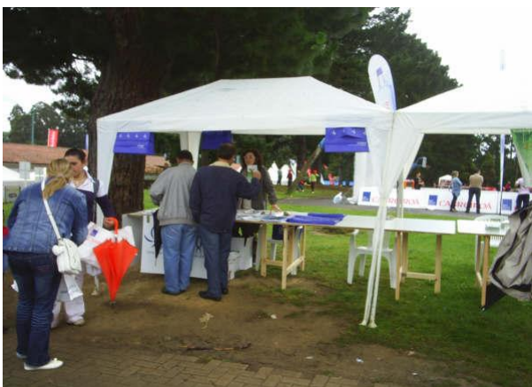
Stand informativo de Coeticor

El pasado día 6 de junio se celebró la jornada "Voz Natura" organizada por La Voz de la Galicia, con la colaboración de destacadas instituciones y la asistencia del Presidente de la Xunta, la Ministra de Medio Ambiente y el Presidente de La Voz de Galicia, entre otras autoridades. Por primera vez, Coeticor, participó con la instalación de un stand informativo donde se distribuyó diversa documentación en materia de sostenibilidad, asesoramiento a los Consumidores y Usuarios en sus compras responsables, y reclamaciones de productos y servicios, así como los lugares dónde deben acudir en tales circunstancias.