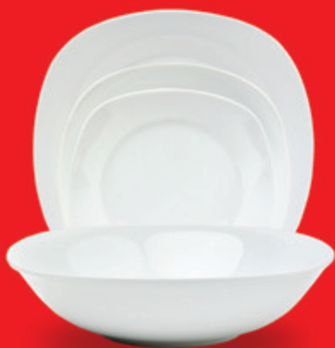
Vajilla modelo ARC de 19 piezas

Identifíquese en su oficina Santander como miembro del Colegio Oficial de Ingenieros Técnicos Industriales de la Coruña, y empiece a beneficiarse de las condiciones preferentes del Acuerdo de Colaboración.