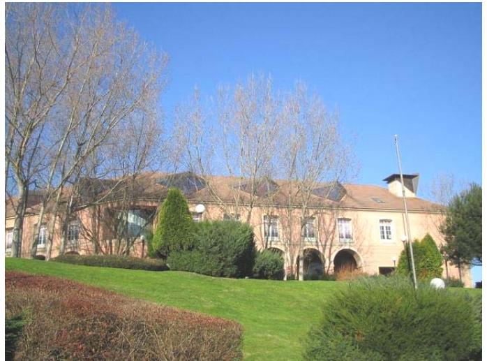
Rectorado de la Universidad de A Coruña

En este aspecto, el Decano del Colegio de Ingenieros Técnicos Industriales de A Coruña, expresa su apoyo al proyecto CAMPUS T: TECNOLOGIA Y TERRITORIO