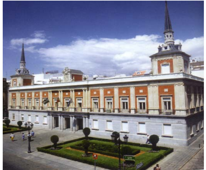
Ayuntamiento de Huelva

En dicho Convenio se manifiesta textualmente “la necesaria existencia de una relación de casualidad directa entre el trabajo profesional y la afectación a la integridad física y seguridad de las personas y la acreditación de que el VISADO es el medio de control mas proporcionado.”