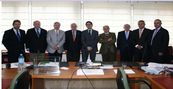
Miembros de la Ejecutiva de COGITI

LOS INGENIEROS TECNICOS MUESTRAN A LA SOCIEDAD LA UNION Y FUERZA DEL COLECTIVO